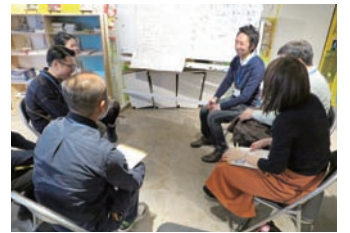
※昨年のリアルトークイベントの様子